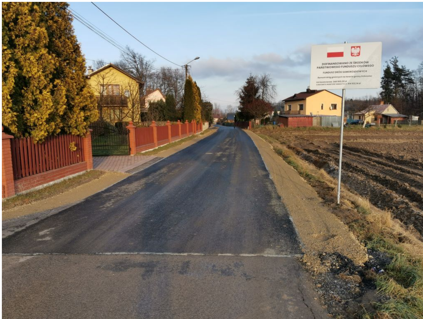
Fot. Droga gminna ul. Cicha w miejscowości Dzikowiec