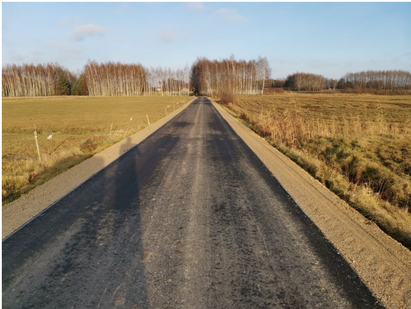
Fot. Droga gminna Mechowiec - Zagrody Mechowieckie w miejscowości Mechowiec