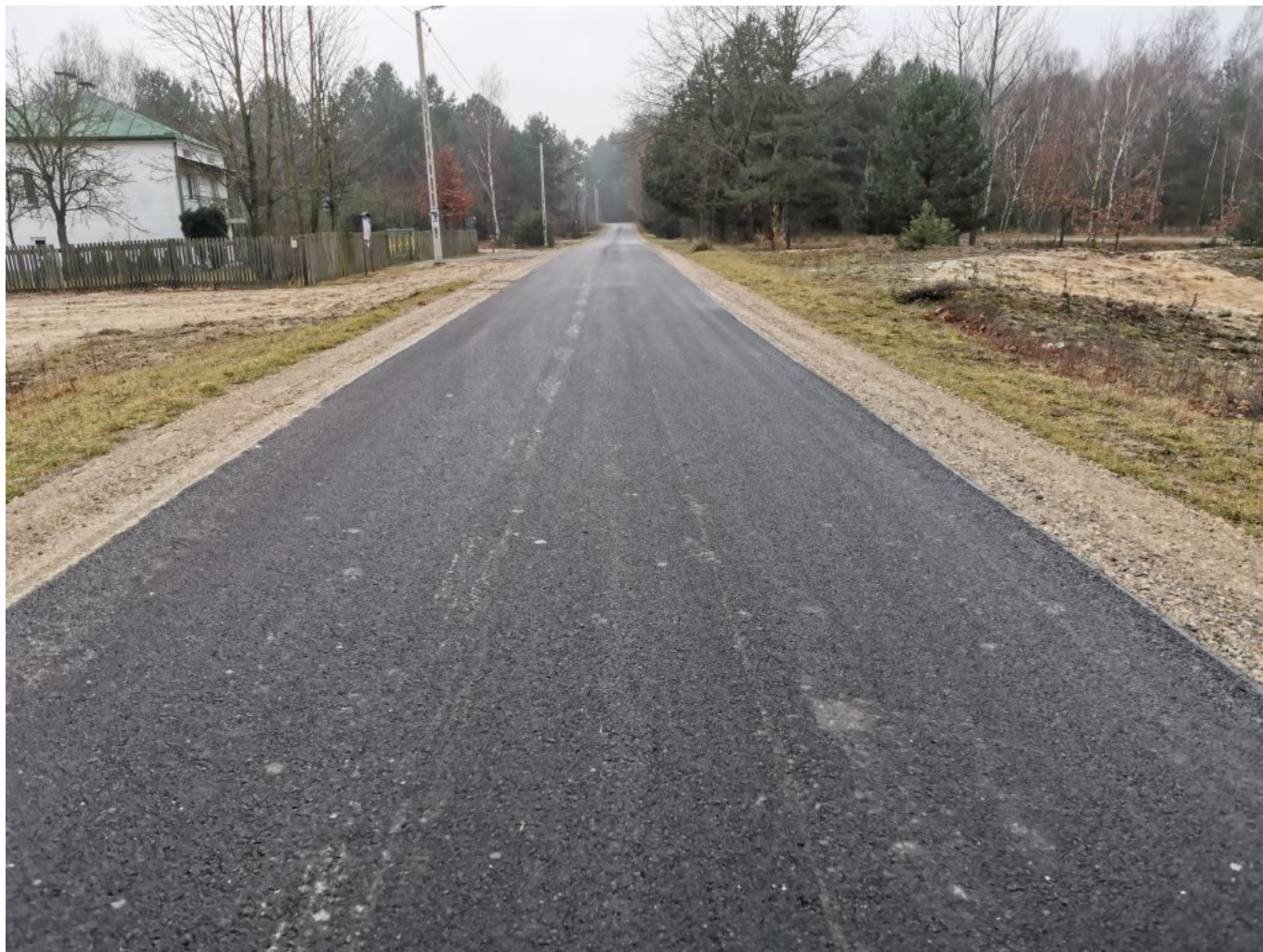
Fot. Droga gminna Wilcza Wola - Sudoły w miejscowości Wilcza Wola

Drugim zadaniem inwestycyjnym było wykonanie „Przebudowy dróg gminnych na terenie gminy Dzikowiec”, w ramach którego przebudowane zostały: