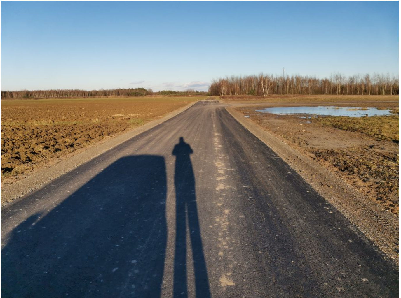
Fot. Droga gminna ul. Ogrodowa w miejscowości Dzikowiec