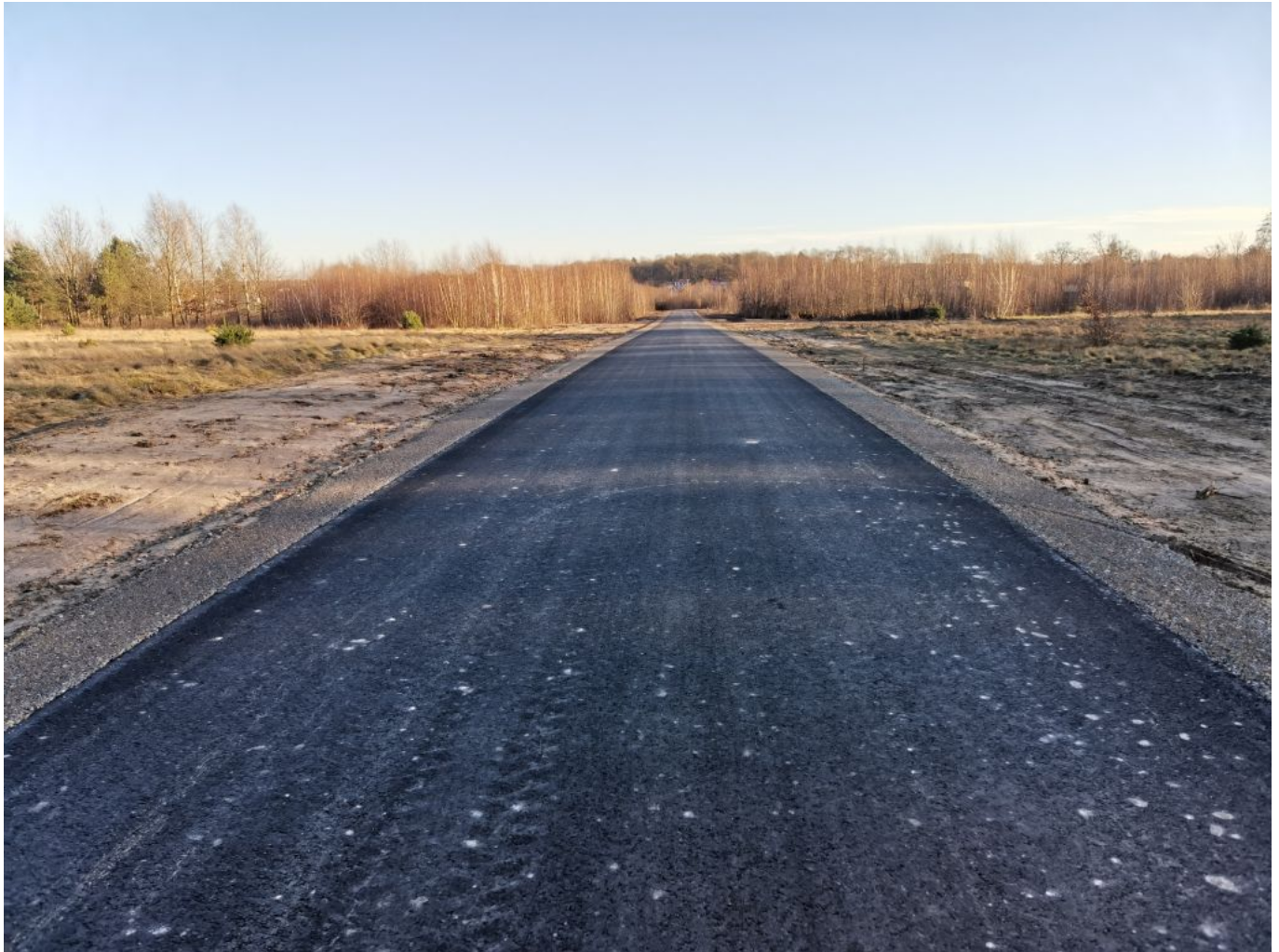
Fot. Droga gminna ul. Plebańska w miejscowości Dzikowiec